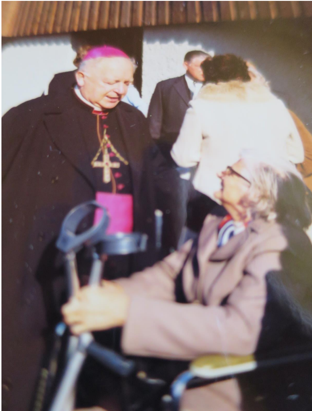
Bischof Josef Hasler im Gespräch