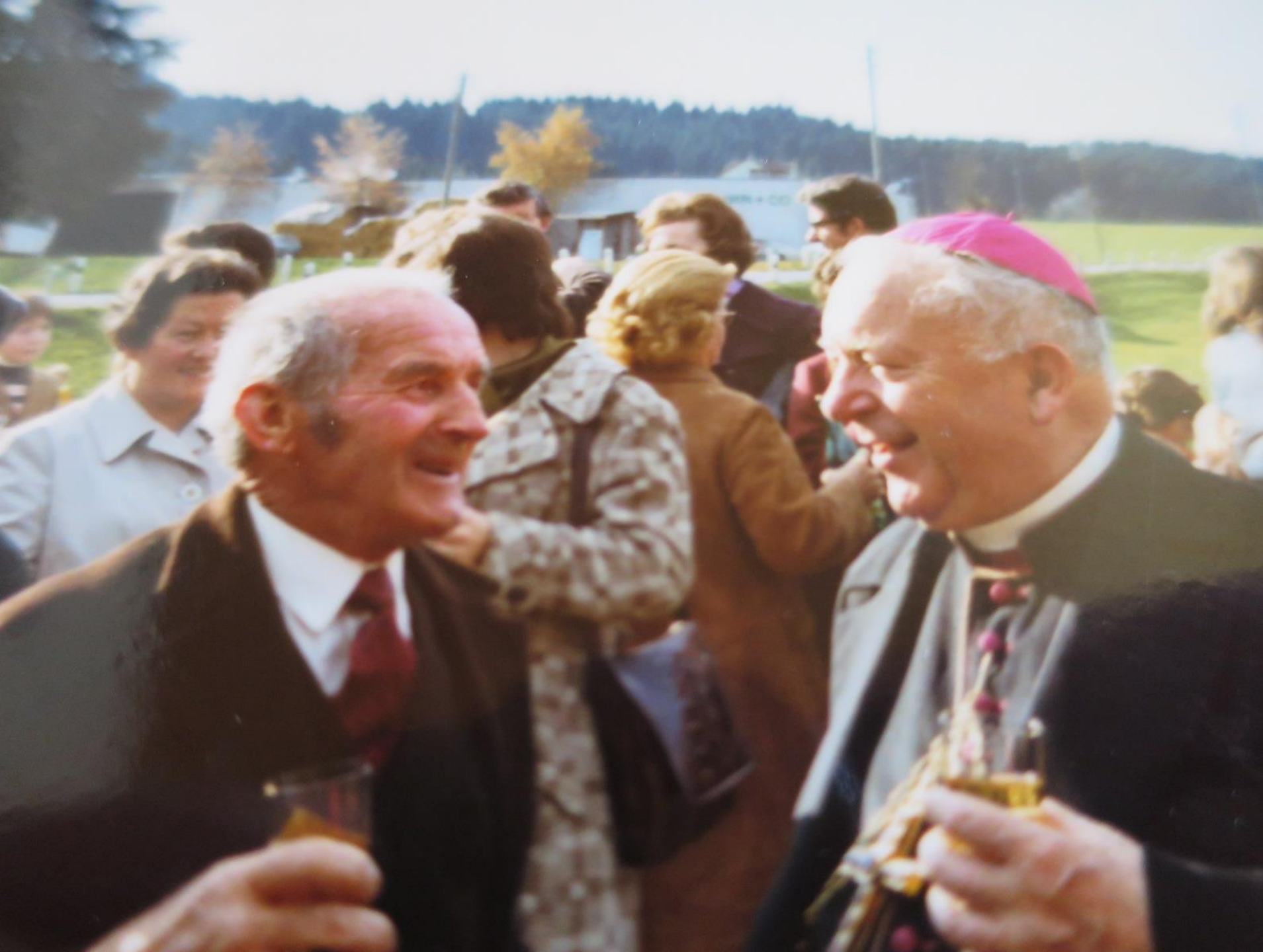
Apéro mit den Bischof und den Gottesdienst- besuchern