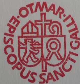
+ Otmar Mäder Bischof

Kirchen-Renovation 1991 Altar – Reliquien: Einweihung des neuen Altars am 24. November 1991 durch Bischof Otmar Mäder. Von den alten Altären der 1937 geweihten Kirche wurden die Reliquien von sechs Heiligen in den neuen Altar eingefügt.