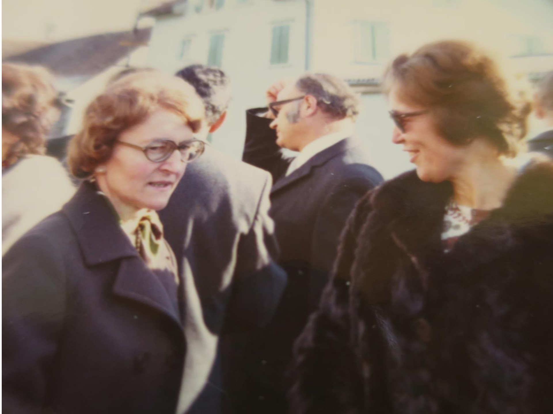
Auch Herisauer- innen freuen sich an der neuen Kirche