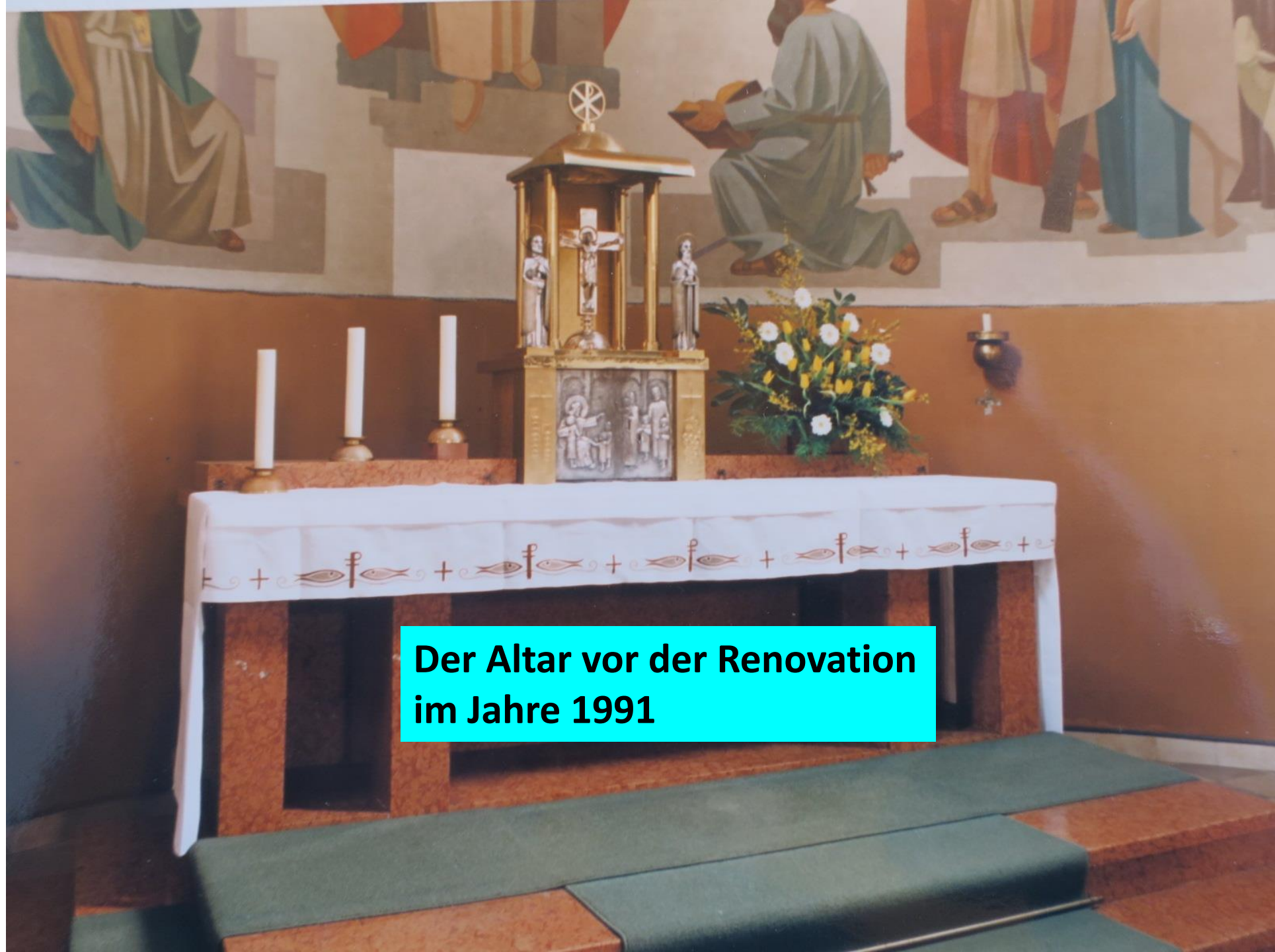
Der Altar vor der Renovation im Jahre 1991