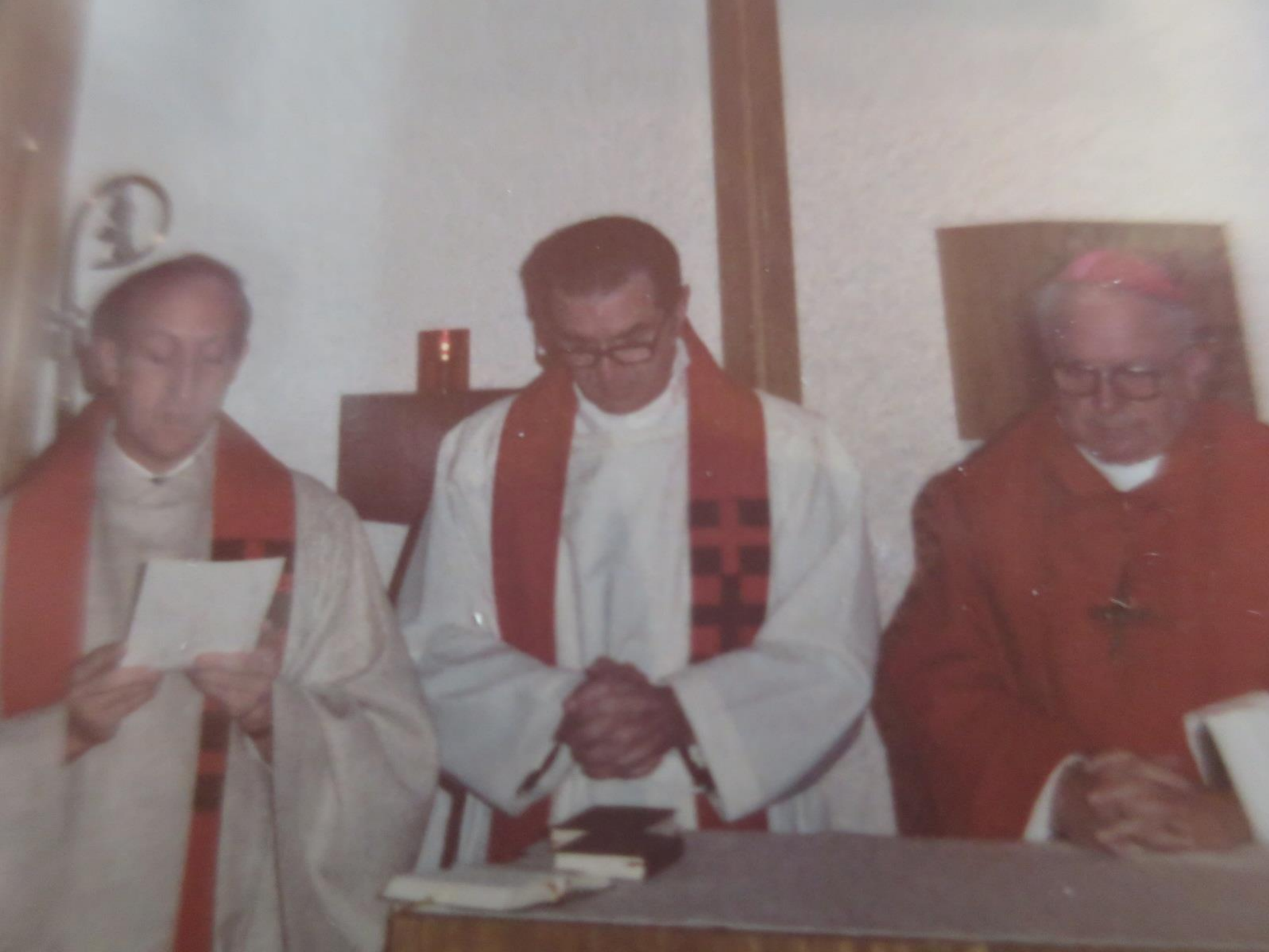
Kirchweih- Gottesdienst in der neuen Kirche